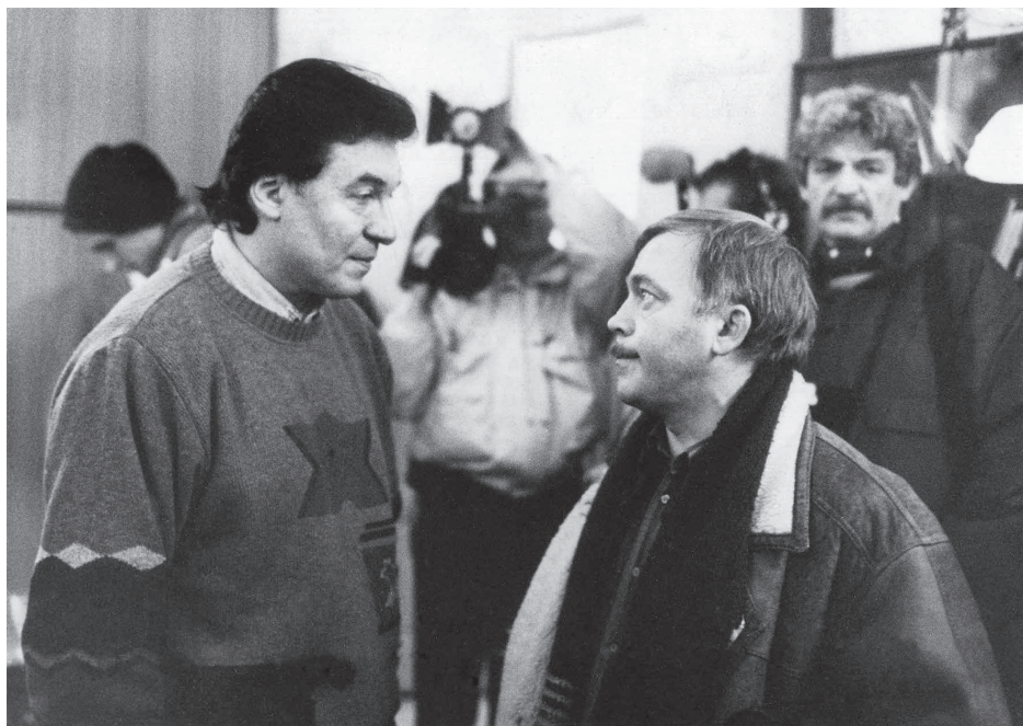
Obrázek 3. Karel Gott a Karel Kryl v předsálí tribuny paláce Melantrich v Praze na Václavském náměstí 27. listopadu 1989.