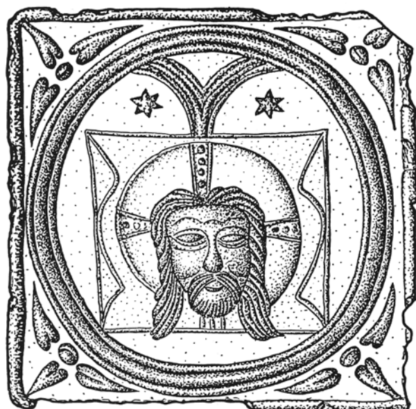
Obr. 2 Kachel s motivem „Veraikon“ nalezený roku 1913, čp. 543, Hradec Králové (Hazlbauer 1994, 130). – Fig. 2 The stove tile with the “Veraicon” motif found in 1913, house No. 543, Malé náměstí, Hradec Králové (Hazlbauer 1994, 130).

Zapátráme-li ve sbírce kachlů Muzea východních Čech, nalezneme jistou podobnost s komorovým kachlem, znázorňujícím motiv „Veraikonu“, který publikoval Ždeněk Hazlbauer (1994, 128–130). Paralelou je zde rouška (takto lze interpretovat roh popsaneho „pole“) s mužskou tváří v kontextu kruhového medailonu.