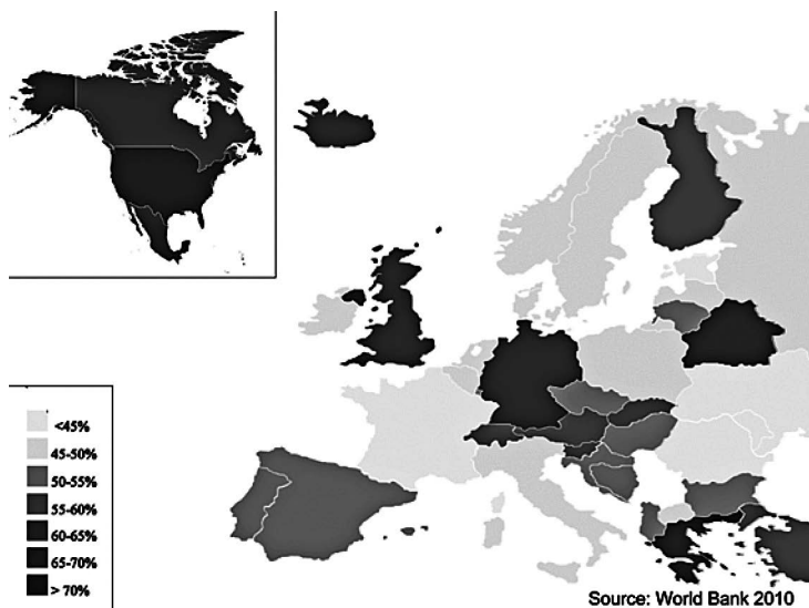
Mapa 3: Procentuální vyjádření poměru obézní populace

Procentuální vyjádření způsobu cestování na počet cest [Bassett et al. 2008: 799]