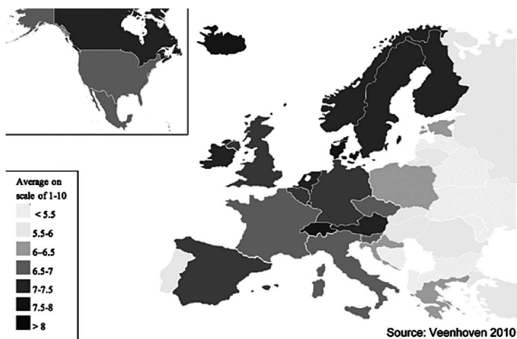
Mapa 2: Štěstí