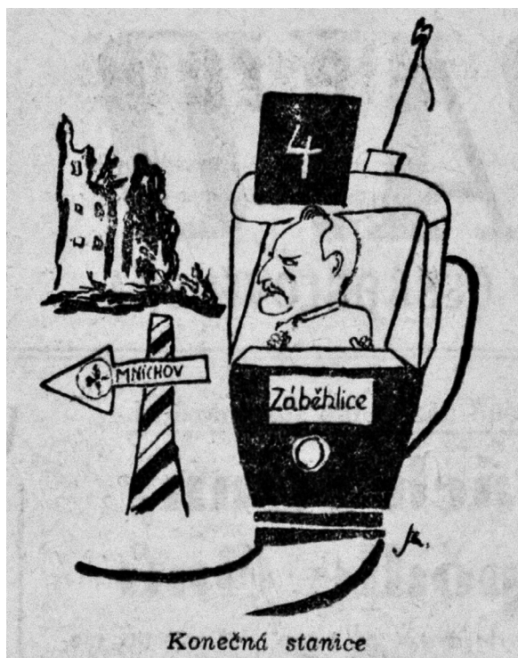
Reakce Rudého práva z 23. května 1946.

symbolem. „Socialismus? Ja, aber nationalistisch und deutscher ... Socialismus? Ano, ale národní a československý. ... Už nikdy Mnichov! Tak začínali němečtí národní socialisté... a tak začínají čeští národní socialisté.“ [Rudé právo 1946 26(123): 5]. Spojování národních socialistů s Německem byl pro komunisty důležitý diskurs, který se snažili v rámci své kampaně udržet.